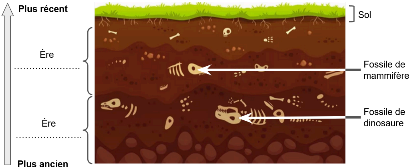
Schéma d'une coupe d'un sous-sol

4 – À partir du document 2, tracer en rouge une séparation entre la couche des dinosaures et la couche des mammifères. Puis indiquer à côté à quel âge s'est terminé le dépôt des débris ayant donné la couche des dinosaures. (C2)